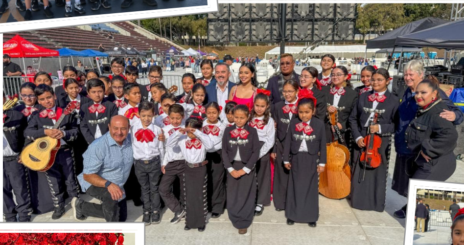
Mariachi Spectacular 2024 We were one of five schools and the only elementary school to perform at this remarkable event. They represented Saint Anne School so beautifully!