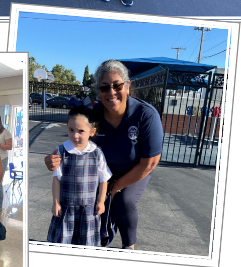
First Day of School