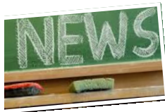
Fiesta de Mayo A fun time was had by all as we raised money for our school.