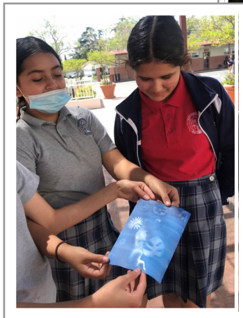
7th grade creates art in the sun!